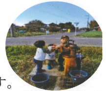
井戸端会議したいなア

家に閉じこもって寂しがっていても、訪ねて来てくれるのは新聞の勧誘とかくらい…自分から声をかけたりしないとね。「こんにちは～暑いねえ」って挨拶から始めています。