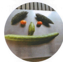
少ないけど収穫祭

無理と無駄とムラがこれまで私の生き方だったけど、無駄とムラはしょうがない。もう無理をすることが出来ないトシになってしまったから、無理はしない。ゆっくりのペースとやめる勇気を大事にしています。なんとかなるさってね。