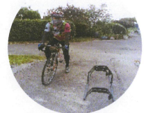
遠くからの応援団

本当はダメな自分だけど、自分で自分を責めるのは自分が可愛そうになって、自分を褒めて動かすしかない、「良いよ～その調子！」などと言いながら畑仕事をしています。ほどほどしか頑張っていない自分だとわかっていても応援します。